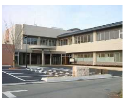
小俣町保健相談センター (小俣町)