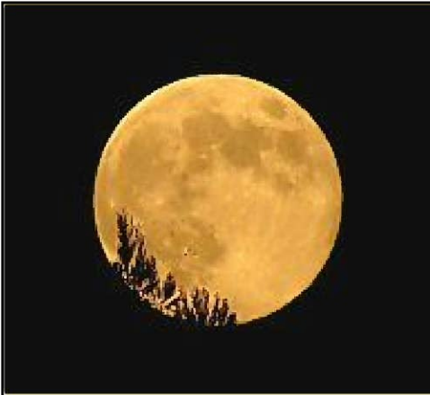
～仲秋の名月(本年9月12日撮影)～

今年は大災が続き、日本全体に暗いイメージがつきまといています。復興にはまだまだ時間がかかりますが、少しでも皆様が元気になるような情報をお伝えしていければと思います。