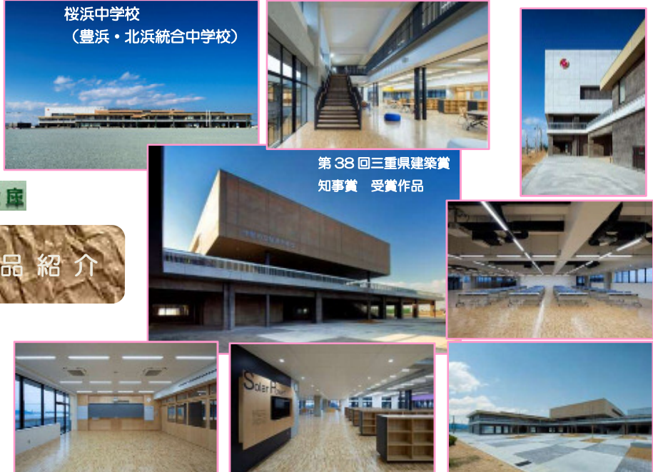
桜浜中学校 (豊浜・北浜統合中学校)

なお、補助金制度・優遇制度(各種奨励金)の詳細につきましては、伊勢市役所・商工労働課または弊社までお問い合わせください。